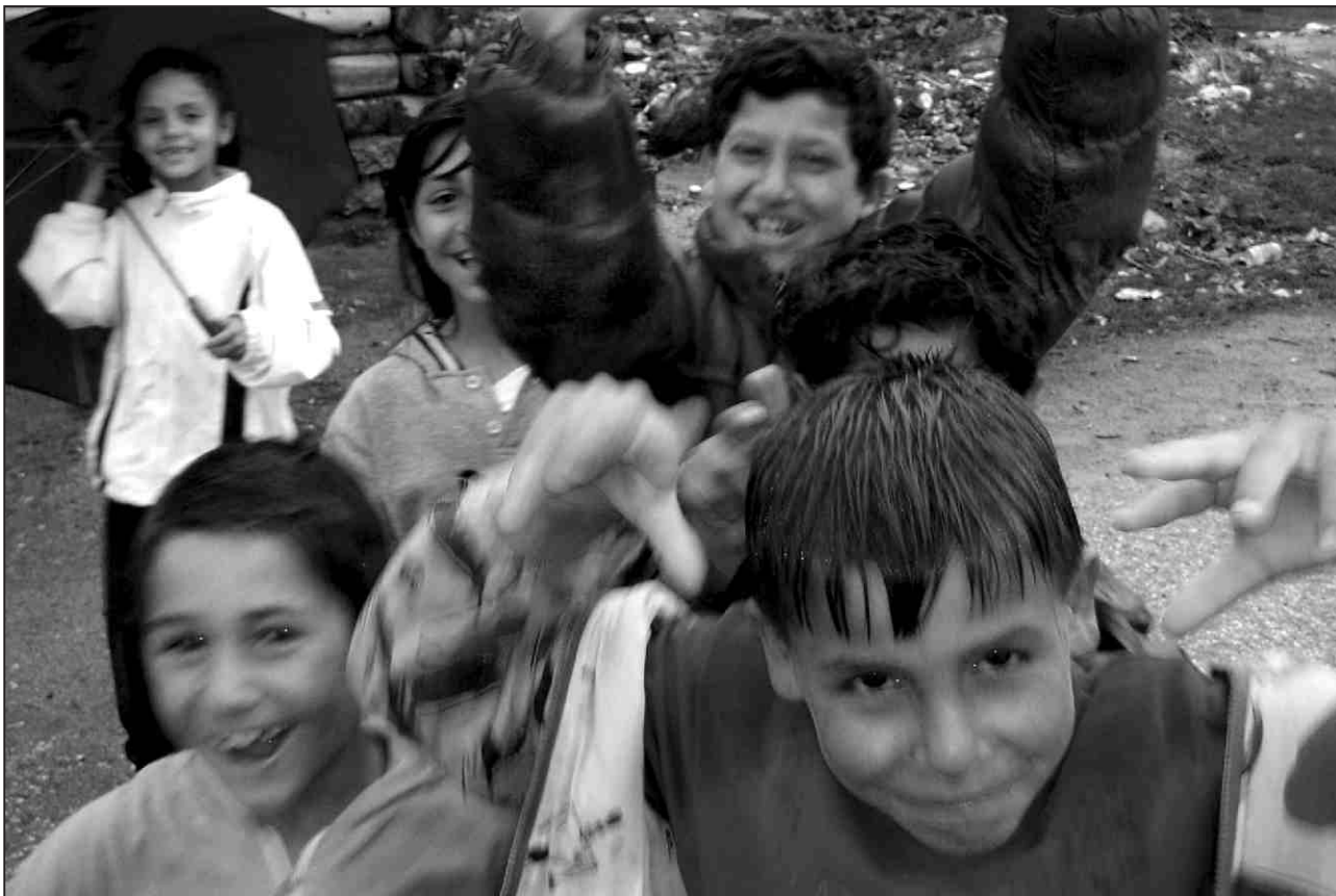
Deti z Velkej Lomnice, Slovensko